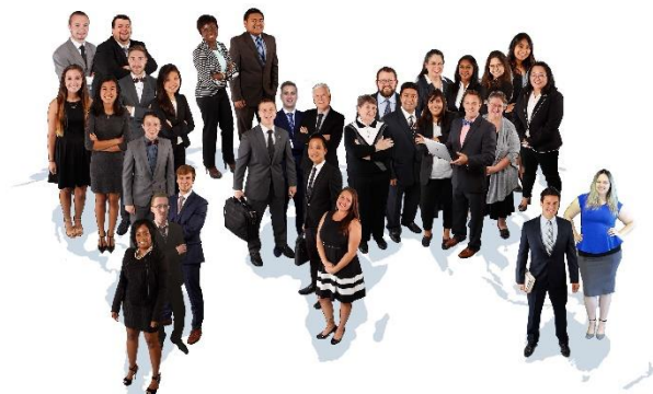
UCO Office of Global Affairs